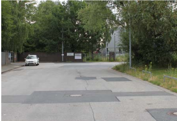
1) Merkurstraße bis zum Ende fahren