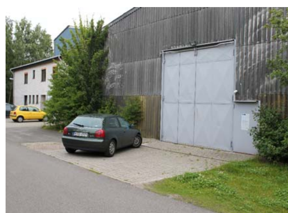
4) Eingang in die Versuchshalle, Ankunftstermin ist zwingend abzustimmen (keine Person vor Ort, min. ½ h vorher anrufen)