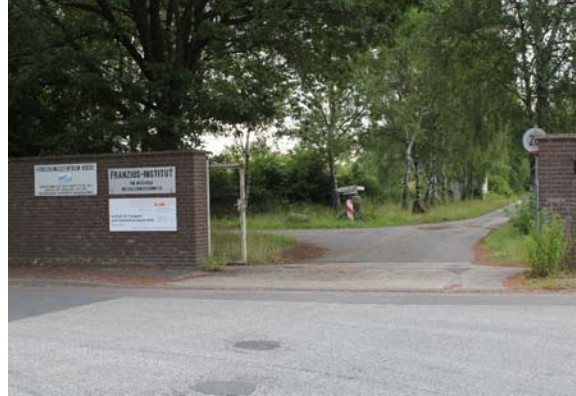
2) durch das Tor fahren, danach sofort 90° links abbiegen