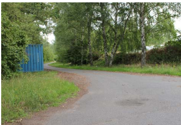
3) Straße ca. 200 m weiter fahren, keine Wendemöglichkeit für LKW vorhanden